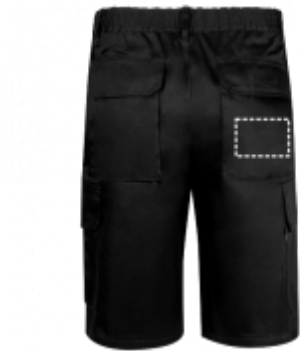
STAMPA TRANSFER Pantaloncini | Tasca posteriore dei pantaloni 100 x 70 mm