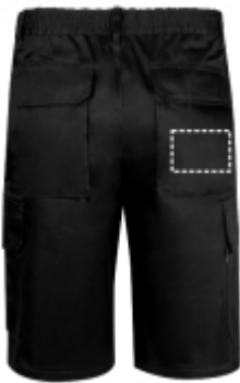
TRANSFER DIGITALE Pantaloncini | Tasca posteriore dei pantaloni 100 x 70 mm