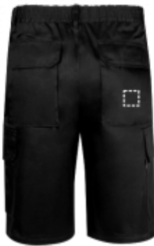
RICAMO Pantaloncini | Tasca posteriore dei pantaloni 35 x 35 mm